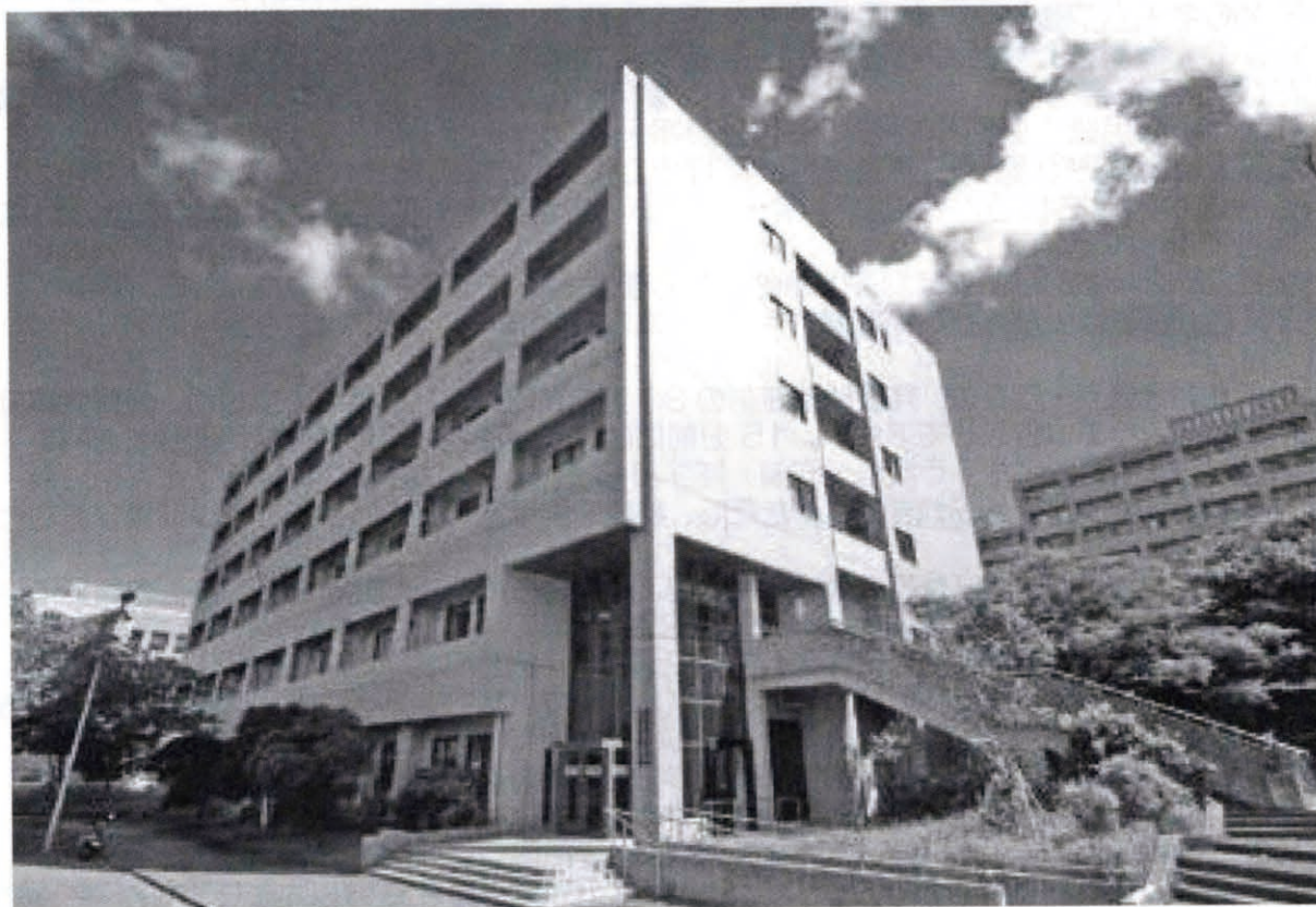
琉球大学医学部保健学科棟